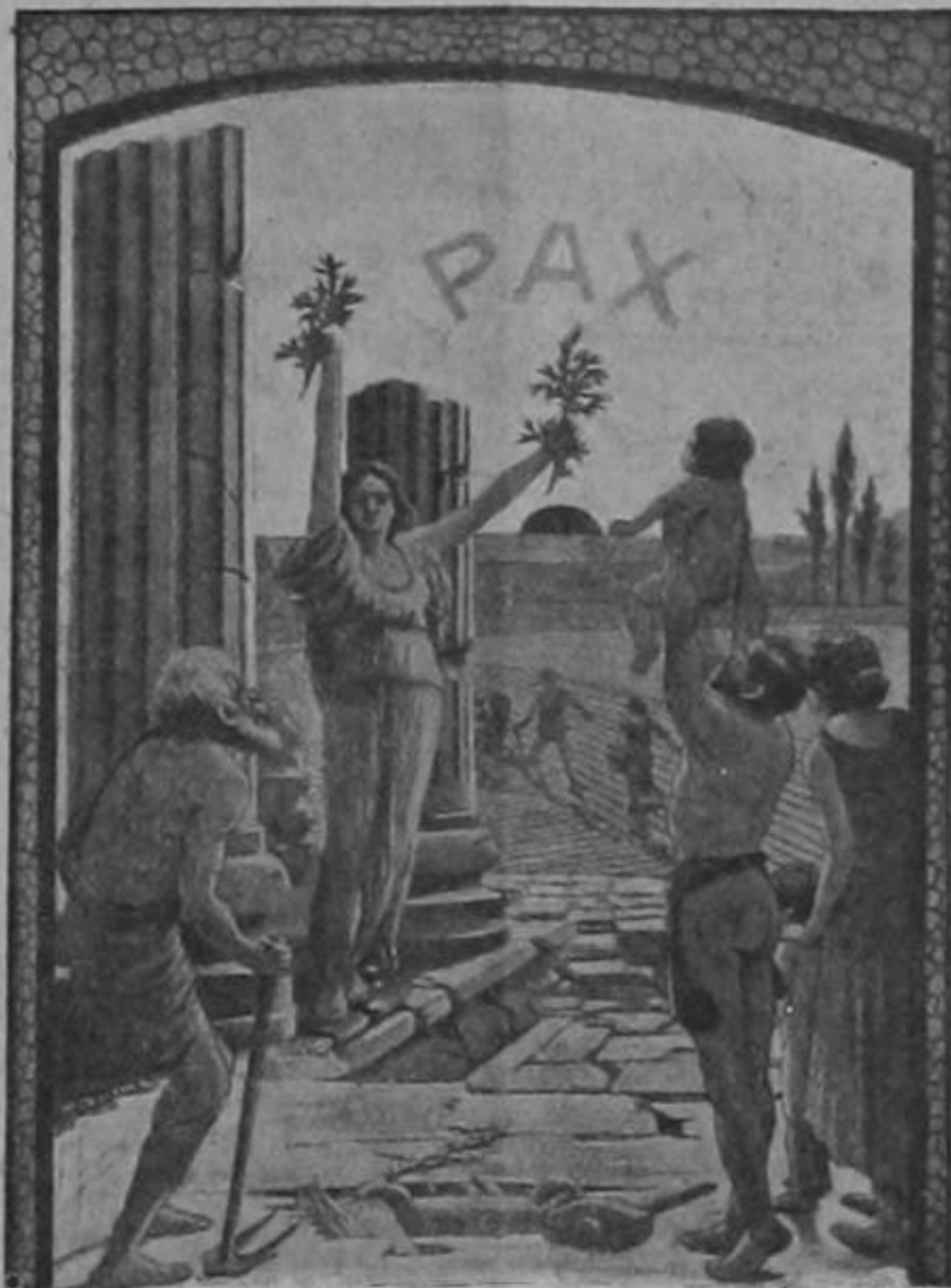
Paz en la tierra sobre las ruinas del Privilegio